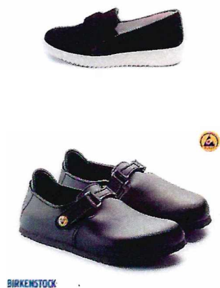
Обувь (резиновая подошва)