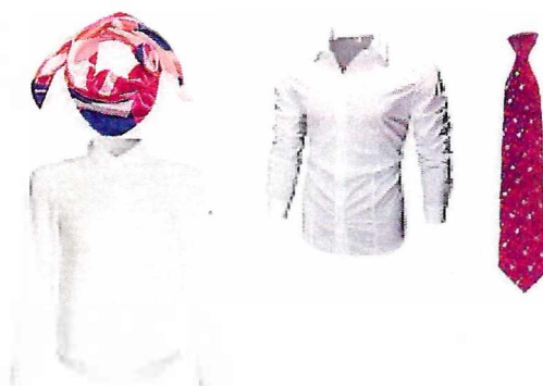
Блузка (сорочка) БЕЛАЯ Галстук (юноши), шейный платок (девушки)