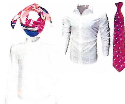
Блузка (сорочка) БЕЛАЯ Галстук (юноши), шейный платок (девушки)