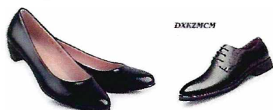
Обувь (деловой стиль – администратор)