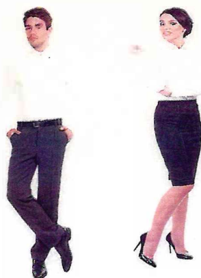
Брюки (юноши), юбка (девушки)