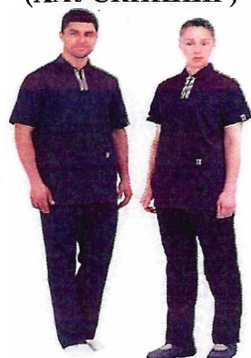
Туника (блузон) + брюки (ХАУСКИПИНГ)