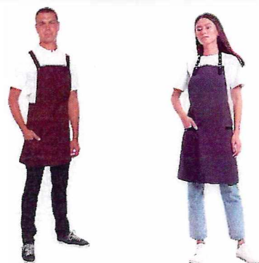
Фартук (РЕСТОРАННЫЙ СЕРВИС)