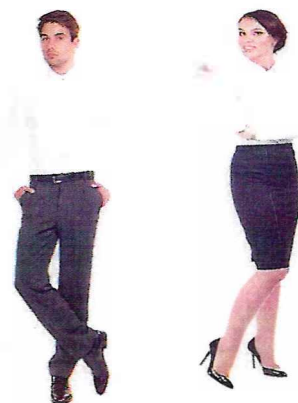
Брюки (юноши), юбка (девушки)