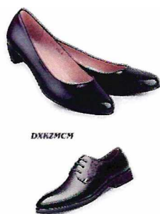
Обувь (деловой стиль – администратор)