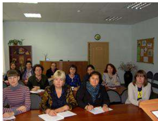
На фотографиях: работа регионального УМО «Сервис и туризм»