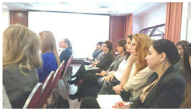
На фотографиях: расширенное заседание Правления Российской Гостиничной Ассоциации с участием Тверского колледжа сервиса и туризма