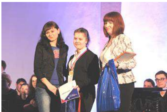
На фотографии: Участие в конкурсе «Молодые профессионалы» студентов Тверского колледжа сервиса и туризма

В 2016 году обучающиеся колледжа приняли активное участие практически во всех районных, городских и областных акциях, посвященных 71-летию Великой Победы. За 2016 год обучающиеся награждены и отмечены в творческой деятельности более 150 грамотами и благодарностями, дипломами и сертификатами. Результаты творческой деятельности обучающихся колледжа представлены в приложении 8 .